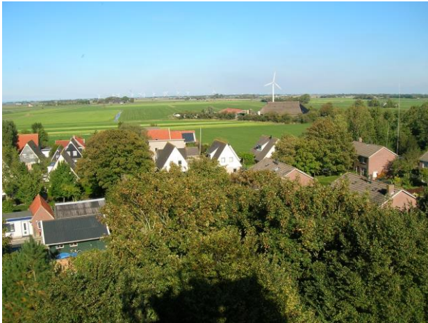
Fanôf de toer nei it noarden ta